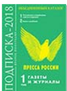
«Пресса России» 40566