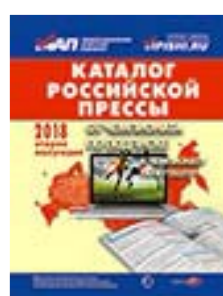
«Каталог российской прессы» 99560