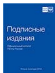
«Подписные издания» Официальный каталог Почты России П2283

Распечатать купон можно на сайте marusia.ru в разделе «Подписка»