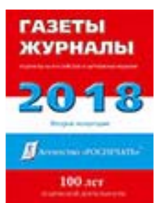
«Газеты. Журналы» 35631

Подписка на журнал «Маруся» (печатная ежемесячная версия) через почту по каталогам