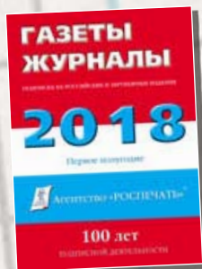
«Газеты. Журналы» 35631