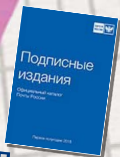
«Подписные издания» Официальный каталог Почты России П2283