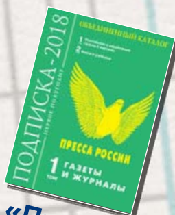
«Пресса России» 40566