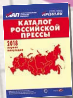
«Каталог российской прессы» 99560