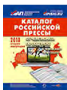
«Каталог российской прессы» 99560