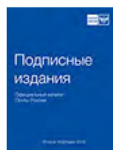
«Подписные издания» Официальный каталог Почты России П2283

Распечатать купон можно на сайте marusia.ru в разделе «Подписка»