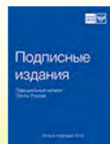
«Подписные издания» Официальный каталог Почты России П2283

Распечатать купон можно на сайте tagisla.ru в разделе «Подписка»