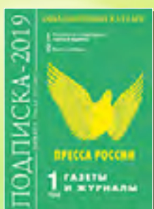
«Пресса России» 40566