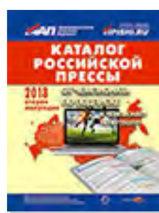
«Каталог российской прессы» 99560