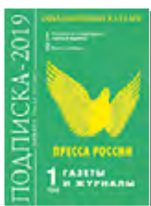
«Пресса России» 40566