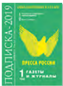
«Пресса России» 40566