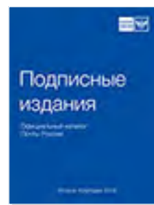
«Подписные издания» Официальный каталог Почты России P2283

Распечатать купон можно на сайте marusia.ru в разделе «Подписка»