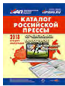
«Каталог российской прессы» 99560