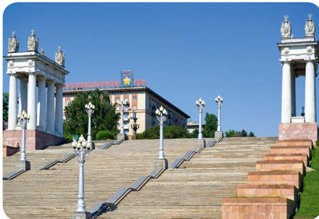
После Великой Отечественной войны Сталинград (с 1961 года — Волгоград) был фактически отстроен заново в стиле так называемого «сталинского ампира».

Первыми городами-побратимами, зародившими международное движение, стали в 1944 году Сталинград и английский Ковентри.