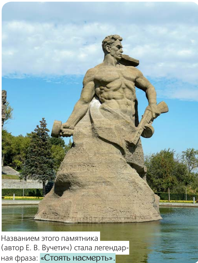
Названием этого памятника (автор Е. В. Вучетич) стала легендарная фраза: «Стоять насмерть».