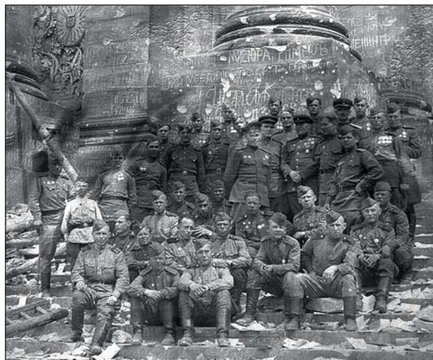
На развалинах Рейхстага. 8 мая 1945 года.

Вспоминая великое прошлое нашей страны, мы запускаем в нашем аккаунте @marusia insta специальные хештеги #нашагордость , #мыбудемпомнить . Заходи и поддержи нас публикациями по ним!