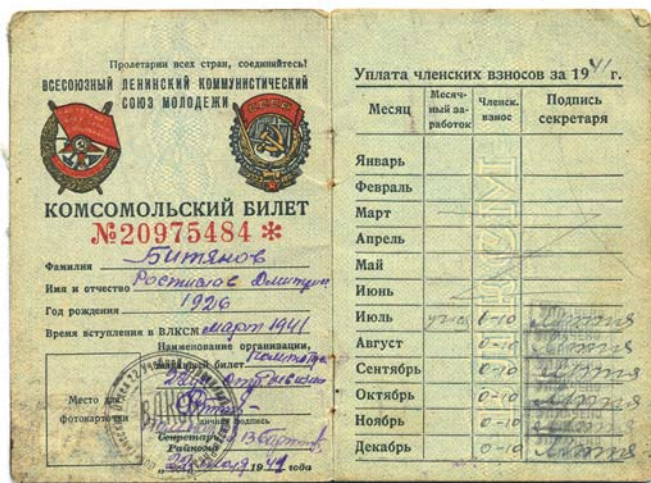
Комсомольский билет, выданный 22 июля 1941 года.

Наутро в селе появились румыны. Они шли пешей колонной и ехали на повозках. Грязные, замученные, вшивые. По ним видно было, что эта война их не очень радует. Втихаря ругали немцев и своих офицеров, которые страшно свирепствовали и с жителями села, и со своими подчиненными. На моих глазах офицер избил палкой до полусмерти пожилого солдата за то,