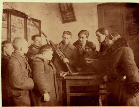
Будущие партизаны из отряда «Буревестник» изучают оружие.